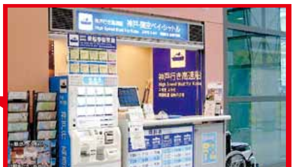
神戶 - 關西機場 海上高速船 (Bay Shuttle) 售票櫃臺